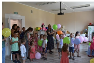
24.06.2023 – Wianki