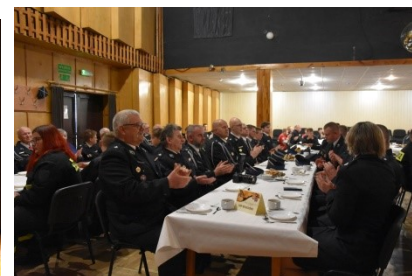
08.05.2023 – Obchody Narodowego Dnia Zwycięstwa