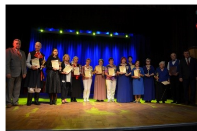
29.10.2023 – Jubileusz Chóru ECHO W Rogoźnie