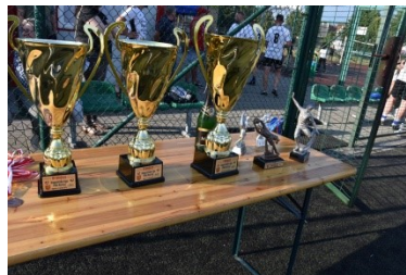
24-25.06.2023 – Noc na orliku