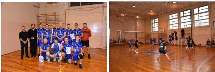
13.04.2023 - Wojewódzki Finał Zawodów Sportowo-Obronnych „SPRAWNI JAK ŻOŁNIERZE-2023” w Rogoźnie