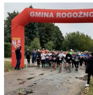
04.11.2023 – 8.Rogoziński Półmaraton Przemysła II