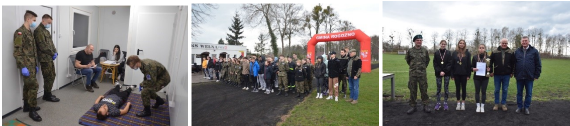
29.04.2023 Otwarcie Gminnej Ligi Piłki Nożnej na Orliku 2023