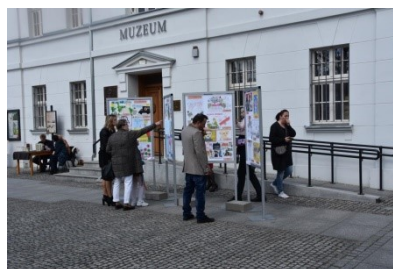
04.05.2023 – Dzień Strażaka w sali RCK