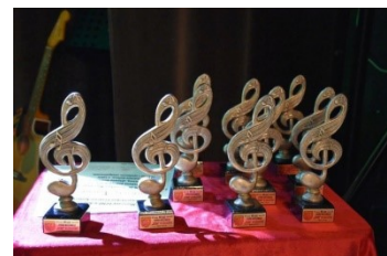
10.12.2022 – Jarmark Bożonarodzeniowy na Targowisku Miejskim