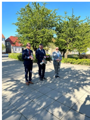
10.06.2023 – uroczyste otwarcie wyremontowanego Oddziału Przedszkolnego w Tarnowie