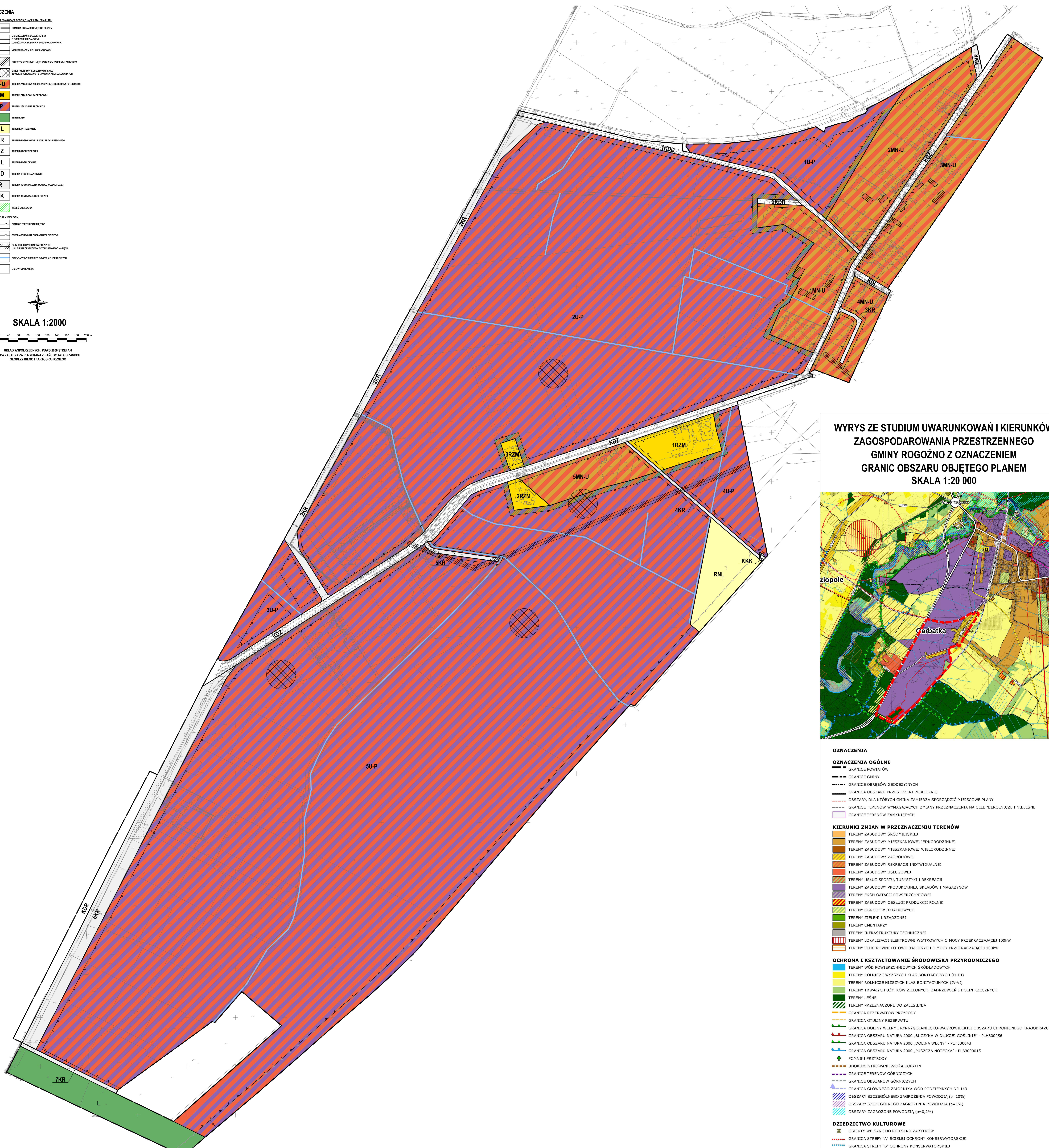
WYRYS ZE STUDIUM UWARUNKÓW I KIERUNKÓW ZAGOSPODAROWANIA PRZESTRZENNEGO GMINY ROGOŹNO Z OZNACZENIEM GRANIC OBSZARU OBJĘTEGO PLANEM SKALA 1:20 000