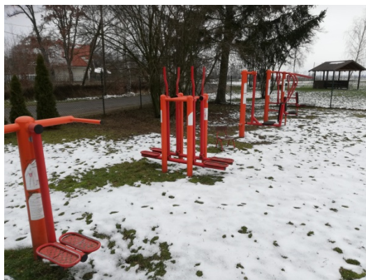
Zdjęcie nr 16 – Siłownia przy świetlicy