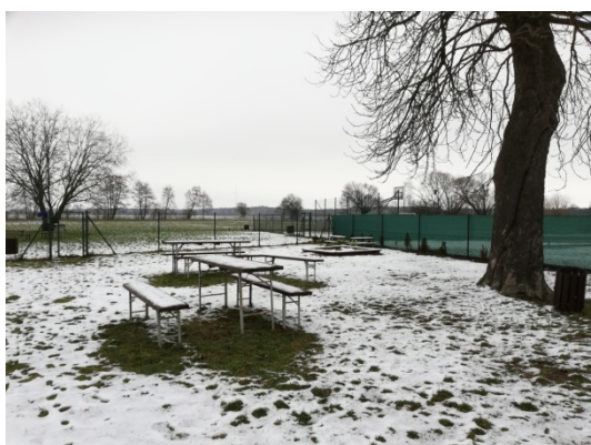
Zdjęcie nr 13 – Teren rekreacyjny przy świetlicy