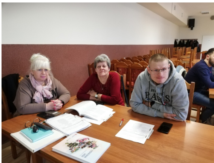
Zdjęcie nr 3 – Praca grupy podczas pierwszego dnia warsztatów

Pierwszego dnia warsztatów członkowie grupy pracowali nad określeniem analizy zasobów . Na podstawie tego dokumentu wskazywali elementy, które oceniają jako silne strony sołectwa i słabe – wymagające zmiany. Wskazywali również na to, jakie szanse i zagrożenia płyną z otoczenia zewnętrznego, które mogą zostać wykorzystane lub ograniczać rozwój sołectwa. W ten sposób przeprowadzono analizę SWOT - analizę, która identyfikuje i wskazuje silne i słabe strony sołectwa, oraz szanse i zagrożenia jakie mają oddziaływanie na sołectwo. Analiza ta uwzględniała poprzedni dokument, który obecnie uległ modyfikacji ze względu na realizację wcześniej zaplanowanych zadań i powstałych nowych oczekiwań mieszkańców do sytuacji panującej obecnie w sołectwie. Każda z wykazanych, obecnie występujących cech, została przypisana do jednego z obszarów potencjału rozwojowego. Są to: Standard życia, Jakość życia, Tożsamość wsi i wartości życia wiejskiego, a także Byt. Uczestnicy warsztatów przeprowadzili również analizę potencjału rozwojowego . Pozwoliło to wskazać najważniejsze cele ogólne oraz zaplanować rozwój tak, aby był on równomierny i wykorzystywał wszystkie obszary interwencji. Finalnie Grupa Odnowy Wsi wskazała wizję hasłową i wizję opisową sołectwa.