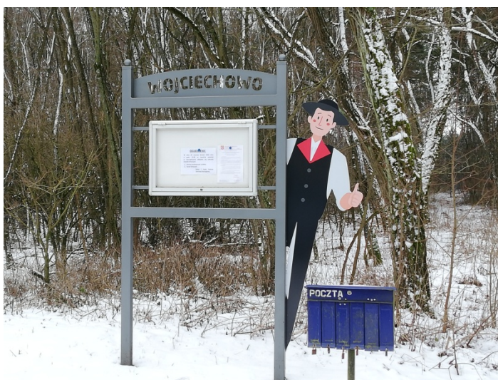
Zdjęcie nr 6 – Witacz przy drodze wjazdowej do Wojciechowa

Owczegłowy to wieś znajdująca się w odległości 3 km na południowy wschód od Rogoźna w niewielkim oddaleniu od Jeziora Rogozińskiego. XVIII-to wieczny plan pokazywał zwartą zabudowę wokół prostokątnego placu lecz w późniejszych latach układ ten uległ zmianie między innymi na wskutek pożaru w 1822 roku.