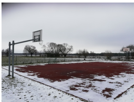
Zdjęcie nr 14 – Boisko do gry w kosza