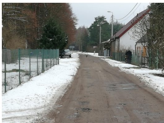
Zdjęcie nr 19 – Droga gruntowa w Wojciechowie