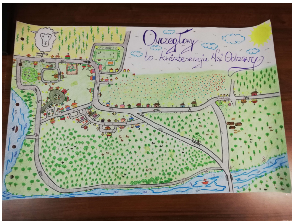
Zdjęcie 21 - Wizja obrazkowa miejscowości wykonana podczas warsztatów przez Przedstawicieli GOW