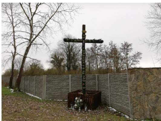
Zdjęcie nr 17 – Krzyż przydrożny