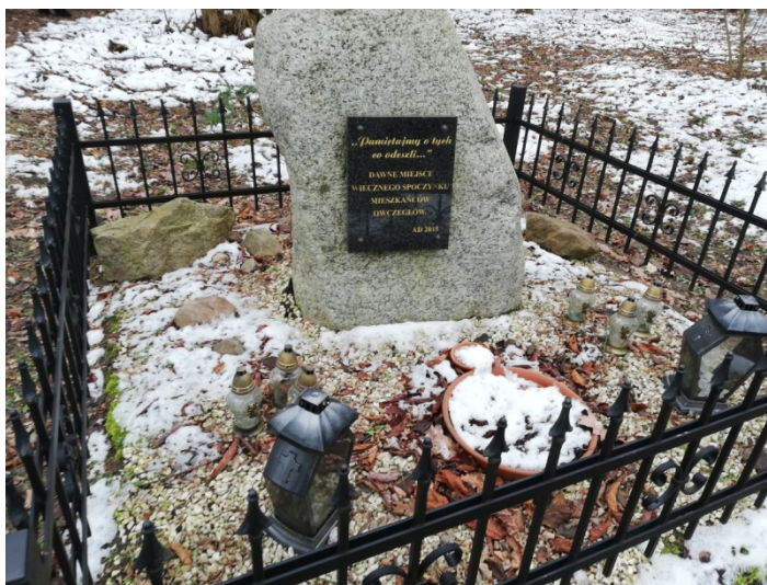
Zdjęcie nr 7 – Miejsce pamięci z tablicą pamięci

We wsi Owczegłowy na niewielkim wzgórku położony jest stary cmentarz. Fragmenty tablic nagrobnych wskazują na daty pochówków z XIX i XX wieku. Cmentarz jest bardzo zniszczony. Również i w Wojciechowie znajduje się niewielkie miejsce pochówku dla tutejszych mieszkańców z okresu sprzed II wojny światowej.