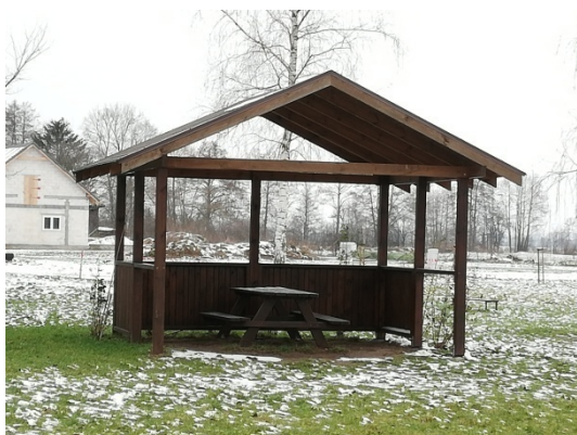
Zdjęcie nr 11 – Altana przy świetlicy wiejskiej