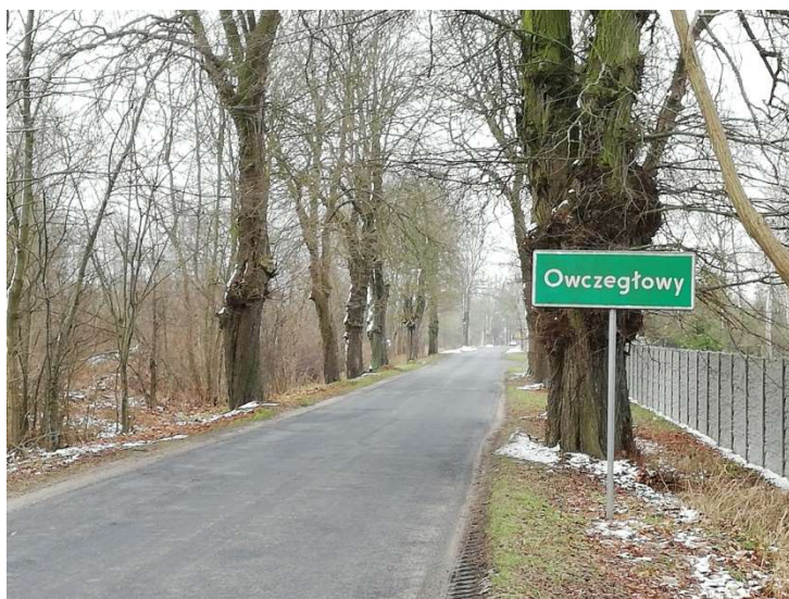
Zdjęcie nr 1 – Wjazd do miejscowości