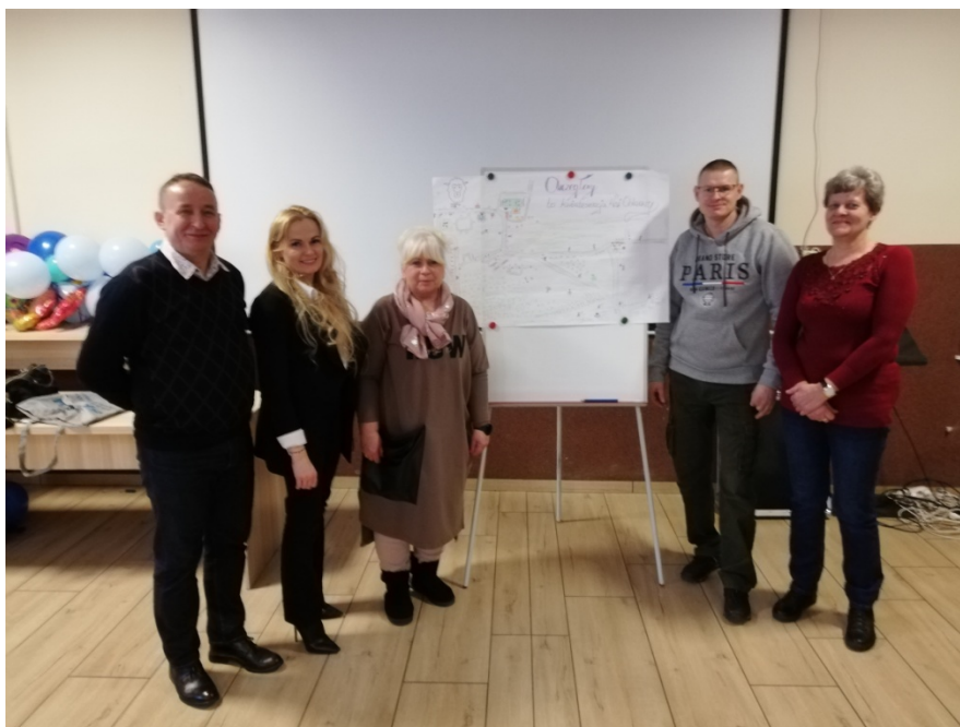
Zdjęcie nr 20 - Prezentacja wizji obrazkowej miejscowości