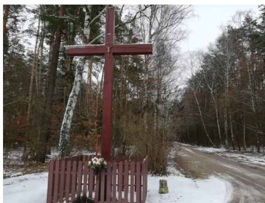
Zdjęcie nr 18 – Przydrożny krzyż