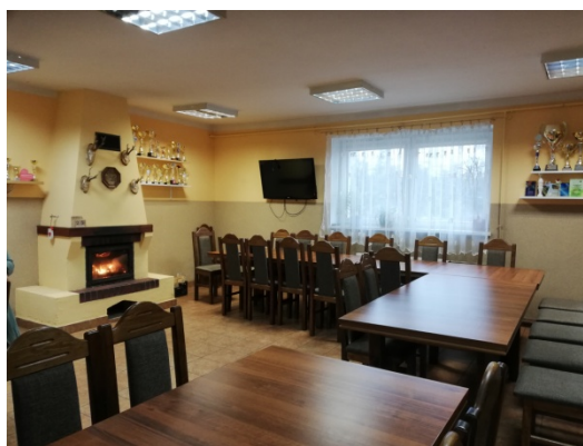
Zdjęcie nr 12 – Wnętrze świetlicy wiejskiej