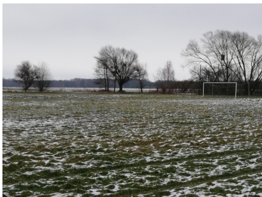
Zdjęcie nr 15 – Boisko do gry w piłkę nożną