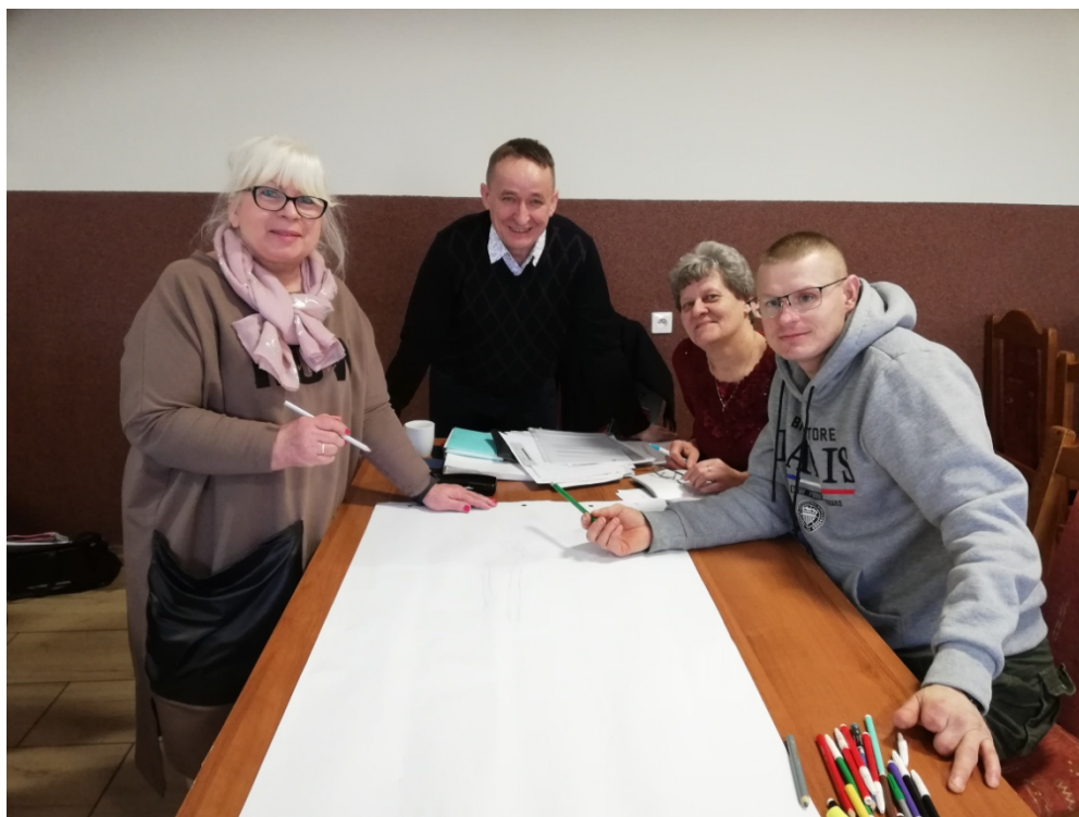
Zdjęcie 22 - Praca przedstawicieli GOW nad stworzeniem wizji obrazkowej