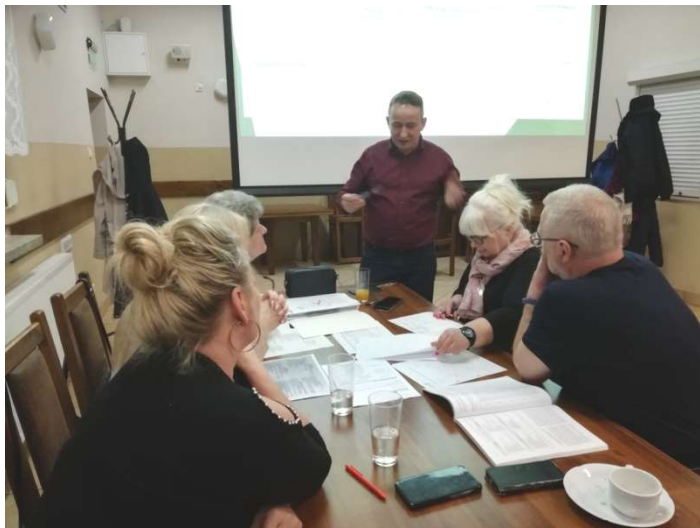
Zdjęcie nr 4 – Praca grupy podczas drugiego dnia warsztatów

Drugiego dnia warsztatów mieszkańcy zobowiązani byli wskazać, na podstawie przeprowadzonych wcześniejszych analiz w poszczególnych obszarach rozwojowych sołectwa, planowane zamierzenia projektowe. Tak powstał plan długi i krótkoterminowy rozwoju sołectwa Owczegłowy na najbliższy rok i 5-lat. W planie krótkoterminowym wskazano te projekty/zadania, które mieszkańcy sołectwa planują zrealizować w pierwszej kolejności – w okresie 12 miesięcy. Następnie w ramach planu długoterminowego zaplanowano zadania na lata przyszłe. W planie długoterminowym wskazano cele jakie sołectwo określiło dla realizacji Wizji Rozwoju Sołectwa . Cele zostały postawione w poszczególnych obszarach interwencji, które Grupa Odnowy Wsi postanowiła osiągnąć poprzez realizację zadań i projektów zapisanych w planie długoterminowym i programie krótkoterminowym.