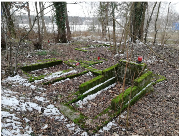
Zdjęcie nr 8 –Pozostałości starego cmentarza

Najważniejszym nośnikiem kultury dla tutejszej społeczności jest świetlica wiejska położona w centrum wsi Owczegłowy przy drodze powiatowej prowadzącej z Rogoźna przez Owczegłowy do Wojciechowo i dalej. W świetlicy regularnie prowadzone są zajęcia. Celem działalności świetlicy w Owczegłowach jest zagospodarowanie czasu wolnego dzieci i młodzieży, sprzyjające wszechstronnemu rozwojowi oraz nadrabianiu opóźnień w tym zakresie. Zajęcia wzbogacają wiadomości, rozwijają umiejętności i wychowują. Prowadzone zajęcia dotyczą najbliższego otoczenia dzieci – rodziny, szkoły, kolegów, obejmują wiadomości o miejscu zamieszkania, Ojczyźnie, miejscu Polski w Europie i świecie. Rozwijają zainteresowania przyrodnicze i kulturalne. Odpowiednio dobrane, ciekawe zabawy i gry wzbogacają wiadomości i doświadczenie dzieci, kształtują umiejętności, angażują emocjonalnie dając okazję do oceniania i wartościowania zachowań. Oprócz tego w świetlicy odbywają się spotkania okolicznościowe mieszkańców, wieczory filmowe, prezentacje, przedstawienia, zabawy, dyskoteki oraz systematyczne zajęcia boccii. Świetlica służy również tutejszemu stowarzyszeniu „Baranek” do realizacji celów statutowych oraz przeprowadzaniu zadań w ramach różnych projektów. Warto podkreślić, iż oprócz niezbędnych do pracy z dziećmi i młodzieżą pomocy dydaktycznych, w świetlicy znajduje się spory księgozbiór, a na półkach wystawione zostały ostatnie trofea sołectkie w postaci pucharów i dyplomów.