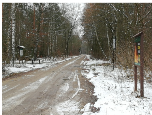
Zdjęcie nr 20 – Tereny leśny