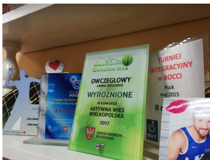
Zdjęcie nr 10 –Dyplomy znajdujące się w świetlicy wiejskiej

Na terenie sołectwa działa utworzone w maju 2011 stowarzyszenie: „Baranek – Stowarzyszenie Na Rzecz Rozwoju i Aktywizacji Społecznej Sołectwa Owczegłowy. Celem Stowarzyszenia jest przede wszystkim podejmowanie działań na rzecz rozwoju Sołectwa Owczegłowy oraz wspieranie społecznej aktywności mieszkańców, w tym w szczególności: promowanie regionu, kultury ludowej, lokalnych tradycji i atrakcji, wspieranie inicjatyw społecznych i gospodarczych wsi, wspieranie dobroczynności i działań humanitarnych, podejmowanie działań na rzecz ochrony środowiska naturalnego, wspieranie inicjatyw społecznych na rzecz budowy nowych i modernizacji istniejących dróg i sieci telekomunikacyjnych, promowanie zdrowego trybu życia oraz podejmowanie inicjatyw w zakresie rozwoju kultury fizycznej i sportu. W 2012 zawiązana została drużyna piłki nożnej seniorów, która uczestniczy w rozgrywkach Gminnej Ligi Piłki Nożnej.