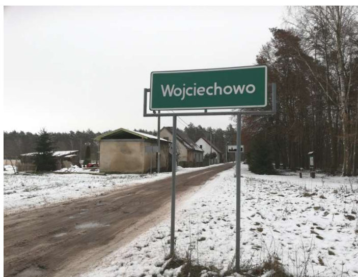
Zdjęcie nr 2 – Wjazd do miejscowości