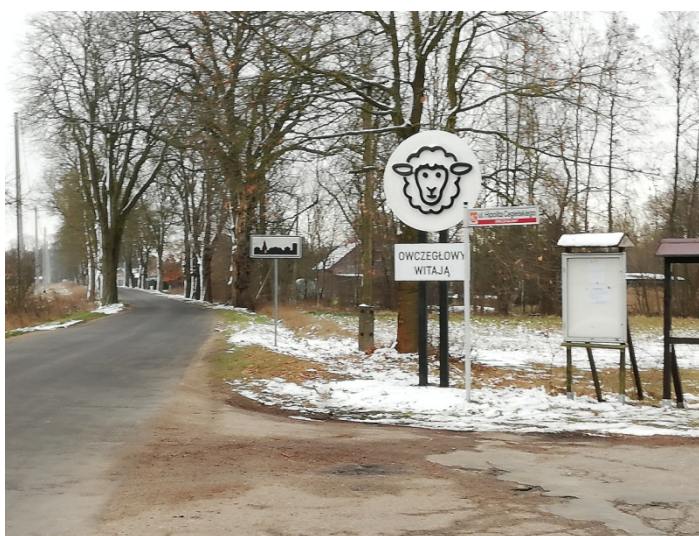
Zdjęcie nr 5 – Witacz przy drodze wjazdowej do Owczegłów

Na terenie sołectwa lasy obejmują obszar 534,24 ha, co stanowi 55,5% obszaru sołectwa. Pochodzenie nazw poszczególnych wsi nie jest do końca znane. Źródła podają różną etymologię, a mianowicie wg jednych Owcze Głowy to nazwa rodowa od przezwiska Owcza Głowa lub wg innych ukształtowanie terenu w formie pagórków przypominających owcze głowy stanowiło podstawę nazwy wsi albo też nazwa wsi pochodziła od hodowli owiec. Na przestrzeni lat pisownia nazwy wsi zmieniała się wielokrotnie (Owcygłowa, Owczegłowy, Owczagłowa, Owcze głowy i obecnie Owczegłowy). Domniemywać natomiast można, że nazwa wsi Wojciechowo pochodzi od imienia właściciela tego terenu.