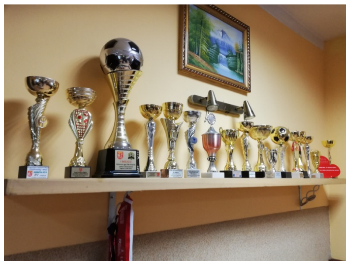
Zdjęcie nr 9 –Trofea znajdujące się w świetlicy wiejskiej

Najważniejszym nośnikiem kultury dla tutejszej społeczności jest świetlica wiejska położona w centrum wsi Owczegłowy przy drodze powiatowej prowadzącej z Rogoźna przez Owczegłowy do Wojciechowo i dalej. W świetlicy regularnie prowadzone są zajęcia. Celem działalności świetlicy w Owczegłowach jest zagospodarowanie czasu wolnego dzieci i młodzieży, sprzyjające wszechstronnemu rozwojowi oraz nadrabianiu opóźnień w tym zakresie. Zajęcia wzbogacają wiadomości, rozwijają umiejętności i wychowują. Prowadzone zajęcia dotyczą najbliższego otoczenia dzieci – rodziny, szkoły, kolegów, obejmują wiadomości o miejscu zamieszkania, Ojczyźnie, miejscu Polski w Europie i świecie. Rozwijają zainteresowania przyrodnicze i kulturalne. Odpowiednio dobrane, ciekawe zabawy i gry wzbogacają wiadomości i doświadczenie dzieci, kształtują umiejętności, angażują emocjonalnie dając okazję do oceniania i wartościowania zachowań. Oprócz tego w świetlicy odbywają się spotkania okolicznościowe mieszkańców, wieczory filmowe, prezentacje, przedstawienia, zabawy, dyskoteki oraz systematyczne zajęcia boccii. Świetlica służy również tutejszemu stowarzyszeniu „Baranek” do realizacji celów statutowych oraz przeprowadzaniu zadań w ramach różnych projektów. Warto podkreślić, iż oprócz niezbędnych do pracy z dziećmi i młodzieżą pomocy dydaktycznych, w świetlicy znajduje się spory księgozbiór, a na półkach wystawione zostały ostatnie trofea sołectkie w postaci pucharów i dyplomów.